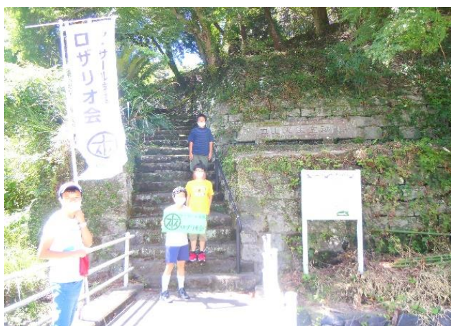
立派な階段と石垣 もともと何かあったのでしょうか

立派な石垣を見ながら階段を上っていきます。おそらく教会があったであろう場所に、十字架が立っていました。そして、隅のほうにマリアさまの像がありました。でもしばらく手入れをしたあとがなく、像が苔むしていたのが残念でした。当時の瓦などが多数残ったまま、さほど広くもないので、土地として活用できるかどうかはわかりませんが、少なくとも鹿児島にとって最初の教会があったところ、巡礼地のひとつとして認められてもよいはずだなと思いました。まずは、マリアさまの像をきれいにしたい、と思ったのですが、このときは掃除の準備をしていなかったのと、巡礼の続きがあったため、そのまま後にしたのです。今度訪れるときには、ぜひ掃除道具を持って、マリアさまの像をきれいにしていきたいと思いました。それにしても、この場所はいったいもともと誰の所有なののでしょうか、そして今は。気になります。今度どなたか皿山教会跡に行ってみませんか。