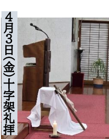
4月3日(金)十字架礼拝