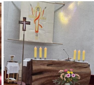
タペストリーの取り換え