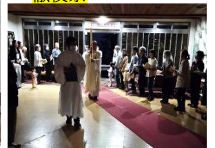
4月4日復活の徹夜祭