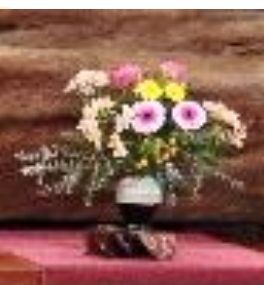
お花のご奉仕 感謝!