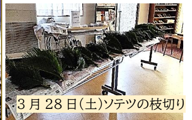
3月28日(土)ソテツの枝切り