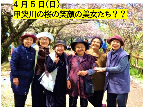
4月5日(日) 甲突川の桜の笑顔の美女たち??