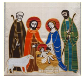
谷山教会聖堂タペストリー

「キリストが千度ベツレヘムにお生まれになっても、あなたの心の中にお生まれにならなかつたら、あなたの魂は捨てられたままです」と。