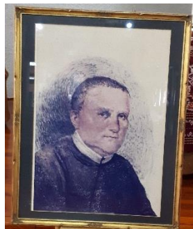
1月5日 記念日 「新大陸の羊飼ひ」 聖ヨハネ・ノイマン司教